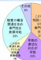
図10. ST必要性の記述内容 図11. 関わる上での留意点 図12. 養成課程での教育 図13. STと健診をめぐって

その他の質問項目として乳幼児健診全般にわたって感じていることについて自由記述で尋ねた。それらの記述を「健診システムについての言及」「健診を通して見える育児の現状についての言及」「健診に対するSTの姿勢・あり方についての言及」「健診等に関わるSTの雇用条件についての言及」「その他の言及」に分類した(図13)。