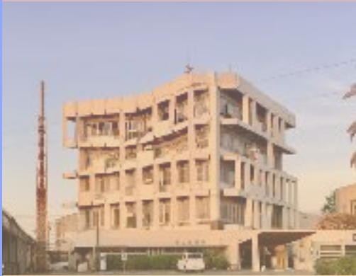
熊本地震後の宇土市役所(現在更地)